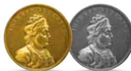
Jan Olbracht (1492-1501)