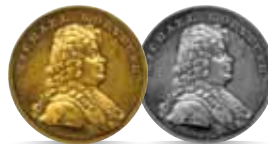
Michał Korybut Wiśniowiecki (1669-1673)