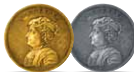
Aleksander Jagiellończyk (1501-1506)