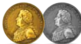
August II Mocny (1697-1706, 1709-1733)