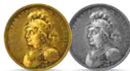
Władysław Warneńczyk (1434-1444)