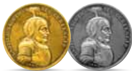
Władysław Łokietek (1320-1333)