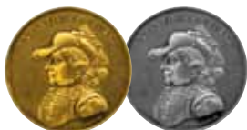
Władysław IV Waza (1632-1648)