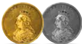
Jadwiga Andegaweńska (1384-1399)