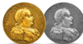
Jan III Sobieski (1674-1696)