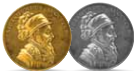
Zygmunt August (1548-1572)