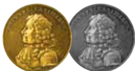
Jan Kazimierz Waza (1648-1668)