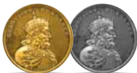
Ludwik Węgierski (1370-1382)