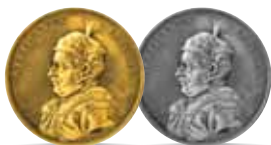
Stefan Batory (1576-1586)