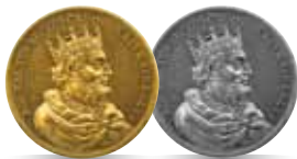
Bolesław Chrobry (992-1025)