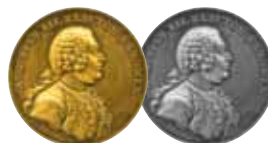
August III Sas (1733-1763)