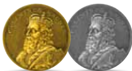
Kazimierz Wielki (1333-1370)