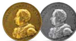
Stanisław Leszczyński (1705-1709, 1733-1736)