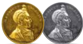
Henryk Walezy (1573-1575)