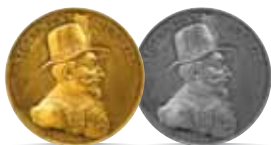
Zygmunt III Waza (1587-1632)