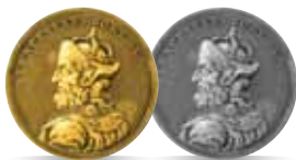
Wacław II Czeski (1291-1305)